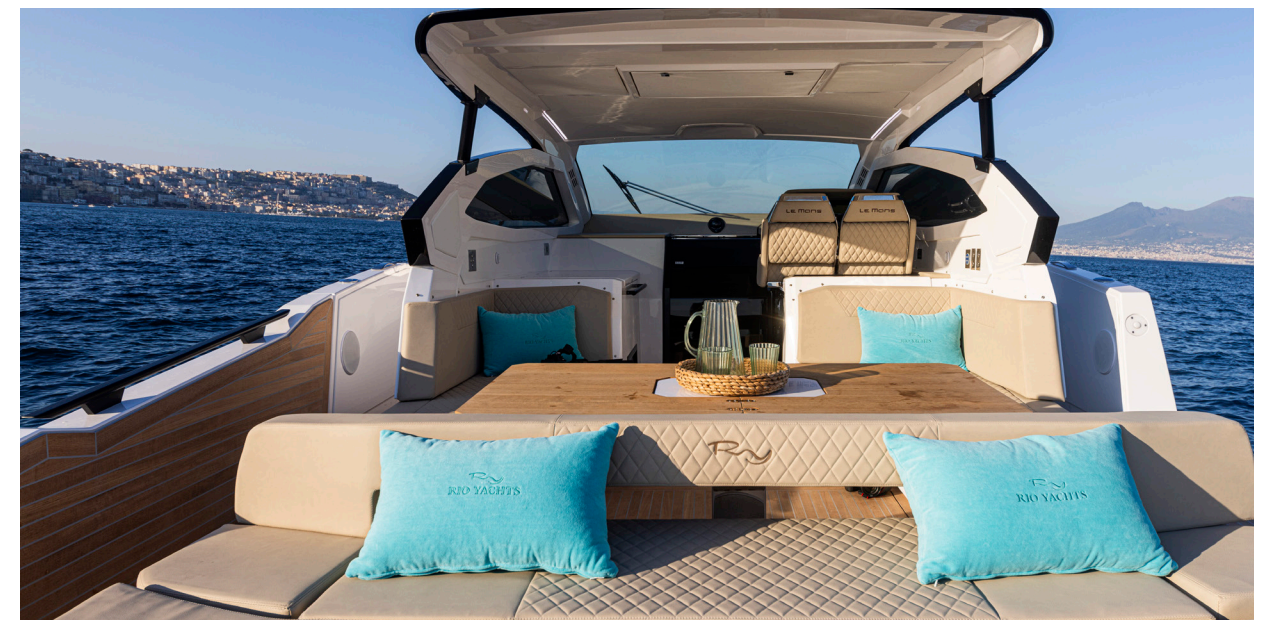
LE MANS 45